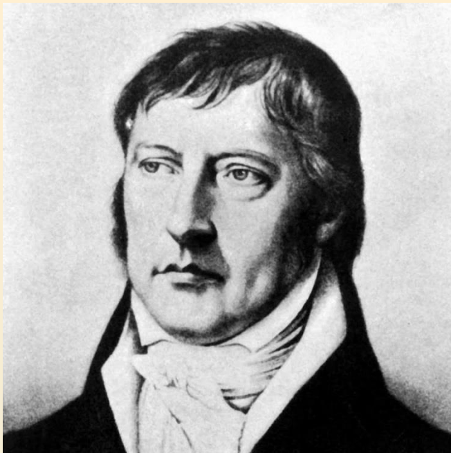
Георг Вильгельм Фридрих Гегель (немецкий философ)

«Не в количестве знаний заключается образование, а в полном понимании, искусном применении всего того, что знаешь».