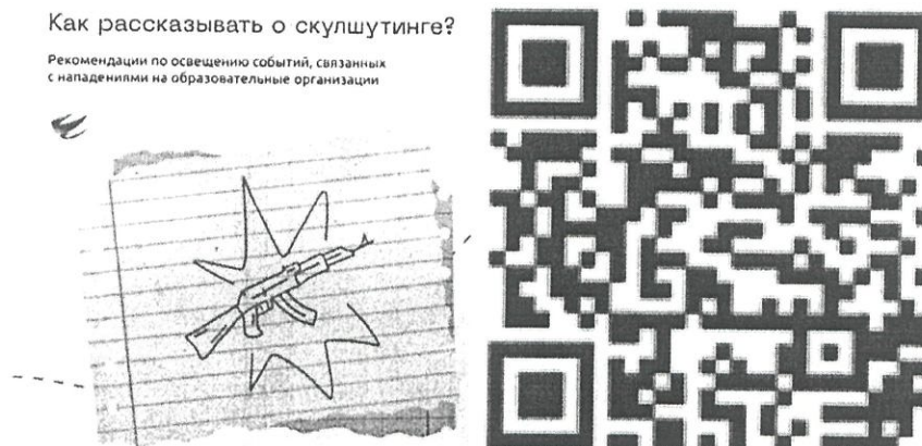
Рисунок 1 — Рекомендации по освещению в СМИ темы скулшутинга

1) «Колумбайн» (другое название «Скулшутинг») — террористическая организация, признанная таковой по решению Верховного Суда Российской Федерации от 02.02.2022 г. № АКПИ21-1059С. Идейная основа – ненависть в отношении образовательных организаций, преподавателей и обучающихся, а также прославление нападавших ранее на образовательные организации. За последние 5 лет в России участились случаи нападения учащихся на учебные заведения. Во многих случаях «скулшутинга, нападавшие в определённой степени копировали сценарий преступления, совершенного в 1999 году учениками школы «Колумбайн» - Э. Харрисом и Д. Клиболдом, а также сценарии других нападений, совершенных уже в России (например, нападение В. Рослякова в 2018 году на Керченский политехнический колледж). Следует помнить, что одна из причин скулшутинга – травля со стороны обучающихся и учителей. Часть нападавших ранее подвергались насилию в классе, группе и в образовательной организации в целом. Поэтому руководству образовательных организаций следует уделять большое внимание ранней диагностике проблем и профилактической работе. Отдельно следует решать важный вопрос недостаточного внимания родителей к проблемам несовершеннолетних (см. рисунок 1).