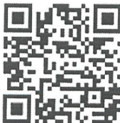
Рисунок 6 — Рекомендации по проведению кинопоказов в профилактике

Среди фильмов по тематике противодействия терроризму можно использовать следующие фильмы: «Беслан. Память» (Россия, 2014 г., возрастное ограничение: 12+), «Кавказский пленник» (Россия, 1996 г., возрастное ограничение: 18+), «Я не террорист» (Узбекистан, 2021 г., возрастное ограничение: 18+), «Отель Мумбаи: противостояние» (США, Австралия, 2018 г., возрастное ограничение: 18+) и т.д.