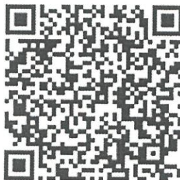
Рисунок 4 — Сценарий для проведения дебатов «Идеология радикализма»

Первая команда всегда будет представлять сторону радикальной идеологии. Задача команды студентов – найти контраргументы тех радикальных и спорных тезисов, которые будет озвучивать первая команда. Тем самым, участники будут вынуждены критически рассматривать постулаты радикальных идеологий, искать в них логические ошибки, несоответствия – самостоятельно приходить к выводу о деструктивности любой радикальной идеологии (см. рисунок 4).