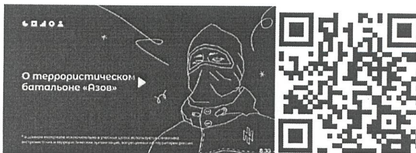
Рисунок 2 – Видеоролик, разъясняющий причины признания организации террористической

3) батальон «Азов» (см. рисунок 2) — военизированное подразделение, созданное в 2014 году на базе футбольных ультрас и праворадикалов Харькова и некоторых других украинских регионов. «Азовцы» причастны к массовым военным преступлениям против мирного населения Донбасса и Украины. Сама организация признана террористической в России по решению Верховного Суда Российской Федерации от 02.08.2022 г. № АКПИ22-411С. Батальон «Азов» входит в состав Национальной гвардии, подчиненной Министерству внутренних дел Украины. С 2014 года боевики батальона «Азов» систематически пытали, убивали и грабили мирных жителей ДНР, ЛНР и востока Украины. У батальона неонацистская идеология. Это проявляется в расизме, русофобии, восхвалении наследия Третьего рейха и украинских коллаборационистов в годы Второй мировой войны. Среди боевиков в том числе распространены радикальные неоязыческие взгляды. Свою идеологию боевики активно распространяют среди украинской молодежи через лагеря подготовки, печатную продукцию (комиксы, книги) и интернет-сообщества. С «Азовом» активно сотрудничает большое количество праворадикальных течений на Украине (признанных в России экстремистскими организациями), например, «Правый сектор», «УНА-УНСО», организация «Тризуб им. Степана Бандеры» и т.д.